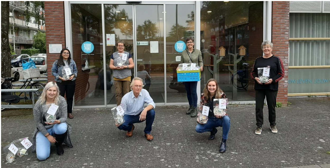
Foto: Hug in a Cup actie van om mantelzorgers een hart onder de riem te steken van Solidez Mantelzorg

In Bijlage 3 laten we zien hoe we deze doelen vertalen in activiteiten. De resultaten van onze activiteiten laten we niet meer zien door aantallen te noemen en te tellen. We vragen onze klanten wel om een klanteffect-monitor in te vullen, waardoor we zicht hebben gekregen op wat al deze activiteiten voor hen opleveren. Voor Solidez zijn in 2020 234 monitor ingevuld met een gemiddelde tevredenheid van 8,4 en rapportcijfer voor kwaliteit van 8,5. Een inhoudelijke rapportage van de activiteiten en van de monitor is te vinden in het jaarverslag van Welsaam.